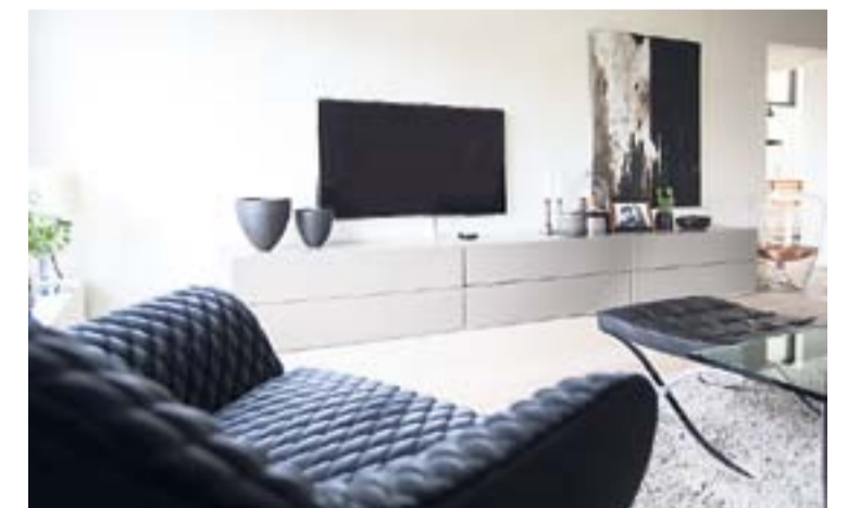
Den lange grå skænk passer fantastisk ind i rummet - ikke mindst i samspillet med de mørke stole og den lyse sofa. Maleriet til højre for tv'et er malet af Dorte Brandt.