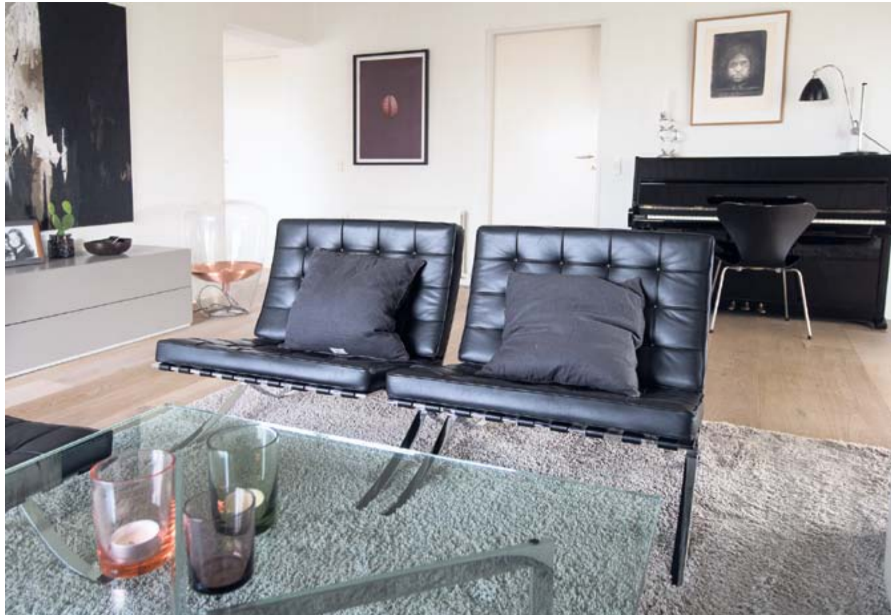
Barcelona-stolene blev designet til det spanske kongepar i forbindelse med verdensudstillingen i 1929, og de er i dag et af verdens mest kendte møbel-ikoner - og dermed også et af de mest kopierede. Glasbordet er designet til serien.