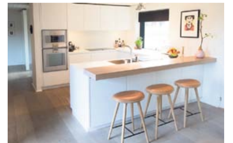
Køkkenet er fra Multiform, og så skal man lige bemærke Cuba-barstolene. De er polstrede, så de matcher 7'er-stolene, som står omkring spisebordet.